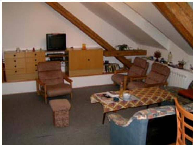
Ukázka z bytu

BNPC - muži úspěšně funguje již třetím rokem. Pobyt v Bytě na půl cesty je dobrovolný, minimální délka pobytu klienta je jeden rok, maximální délka dva roky. Byty na půl cesty se nachází v centru města, kde jsou výborné podmínky pro každodenní konfrontaci klienta s běžným životem a s veřejností (dva mezonetové byty na Štěpánské 8, Brno). V obou bytech bylo v roce 2006 ubytováno celkem 14 mužů , což je plná kapacita tohoto zařízení.