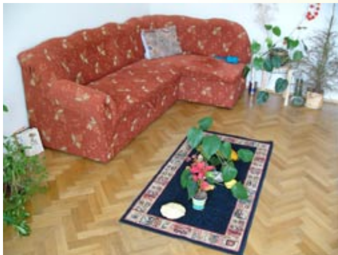
Ukázka z bytu

Byt na půl cesty pro ženskou klientelu byl otevřen v říjnu roku 2005. Pobyť v BNPC - ženy je dobrovolný a minimální délka pobytu je jeden rok, horní hraniční délky pobytu jsou dva roky. Byť je situován nedaleko BNPC - muži, na ulici