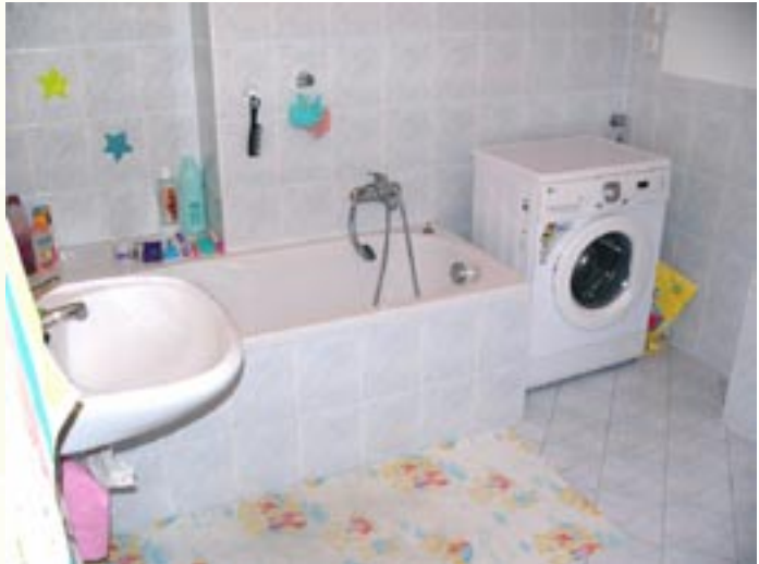
Ukázka z bytu

Terapeuti spolupracují s pracovníky Centra služeb sociální prevence o.s. Lotos Brno. Součástí spolupráce jsou i pravidelné Job kluby realizované přímo v BNPC. V rámci Job Klubů probíhají jednak přednášky týkající se pracovních-právní problematiky, ale také praktické nácviky různých situací souvisejících