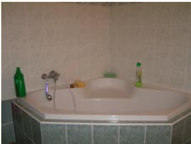
Ukázka z bytu

Během celého roku se tým odborných pracovníků spolu s klienty podílel na vypracovávání standardů kvality sociálních služeb.