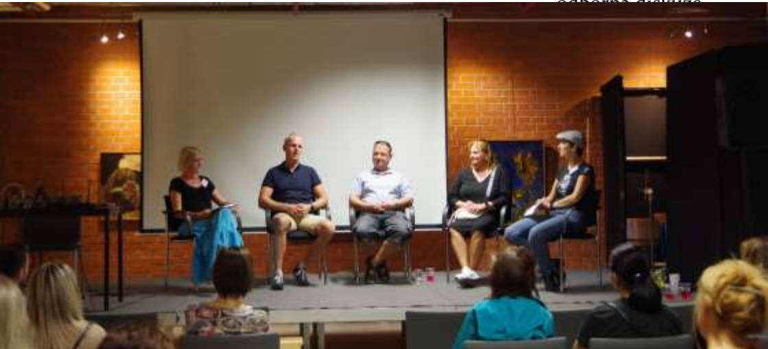
diskuze s klienty Lotosu